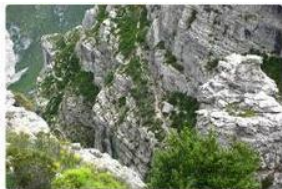
Senda a Forat de la Roca del Migdia

Fes el recorregut curt o el llarg i gaudeix d'un dia de muntanya.