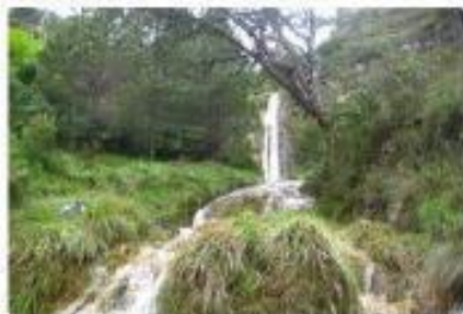
Salt del Raco de la Gralla

A partir de les 7h:45 hi haurà voluntaris del Trail Roquetes que faran entrega de tiquets i detall de la marxa.