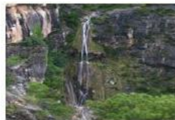
Salt de la Caramella